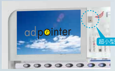
20インチの液晶モニター