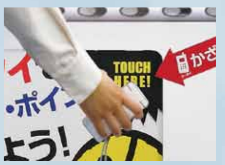
ケータイをかざしてモバイルサイトへ誘導

ボディ部分には、携帯電話をかざすだけで指定したモバイルサイトへ誘導する「非接触ケータイサイト接続ユニット」を搭載しています。QRコードのような手間がかからず、ストレスなしに指定サイトにつながります。ドリンク購入者に近くのスーパーや美容室のオリジナルクーポンなどを配信することができ、地域の活性化にもつながります。