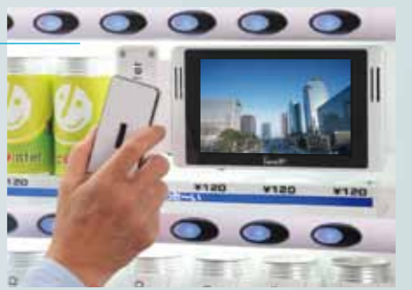
7インチモニター(音声対応) ※オプション対応

非接触ケータイサイト接続ユニットとの強力な連動効果を発揮するのが、音声対応の7インチ小型液晶モニターです。小型液晶モニターでキャンペーン告知やケータイ誘導映像を流し、非接触ケータイサイト接続ユニットへアクセスさせ詳細情報を配信することで、より確実な訴求効果を得られます。